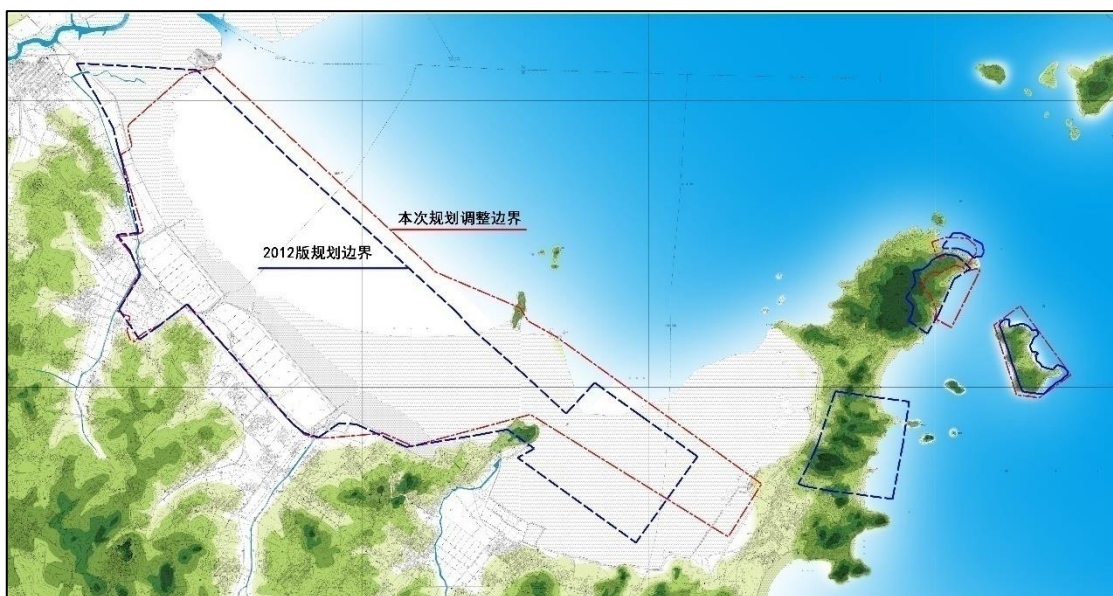
泉惠石化工业园区规划边界调整对比图

泉惠石化工业园区原规划面积 33.80 平方公里，本次规划修编面积为 33.66 平方公里。规划边界依据《泉惠石化工业园区安全控制区专项规划》和《惠安县泉惠石化工业园区防洪防潮排涝规划修编报告》的相关方案进行了局部调整。