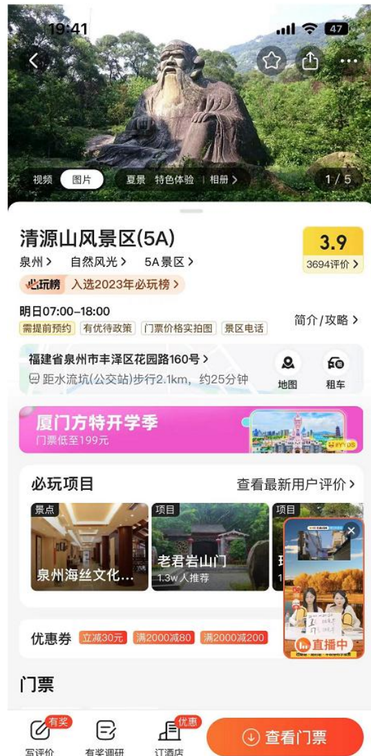
3-4: 美团 APP