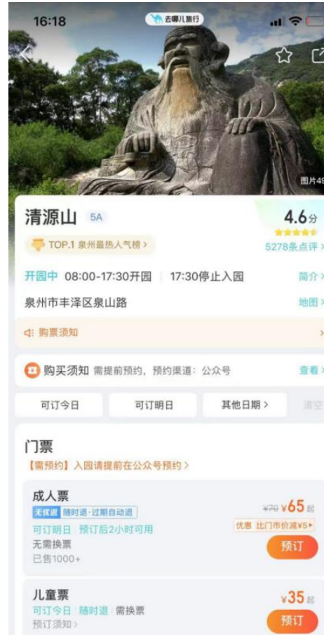
3-2: 去哪儿旅行 APP;