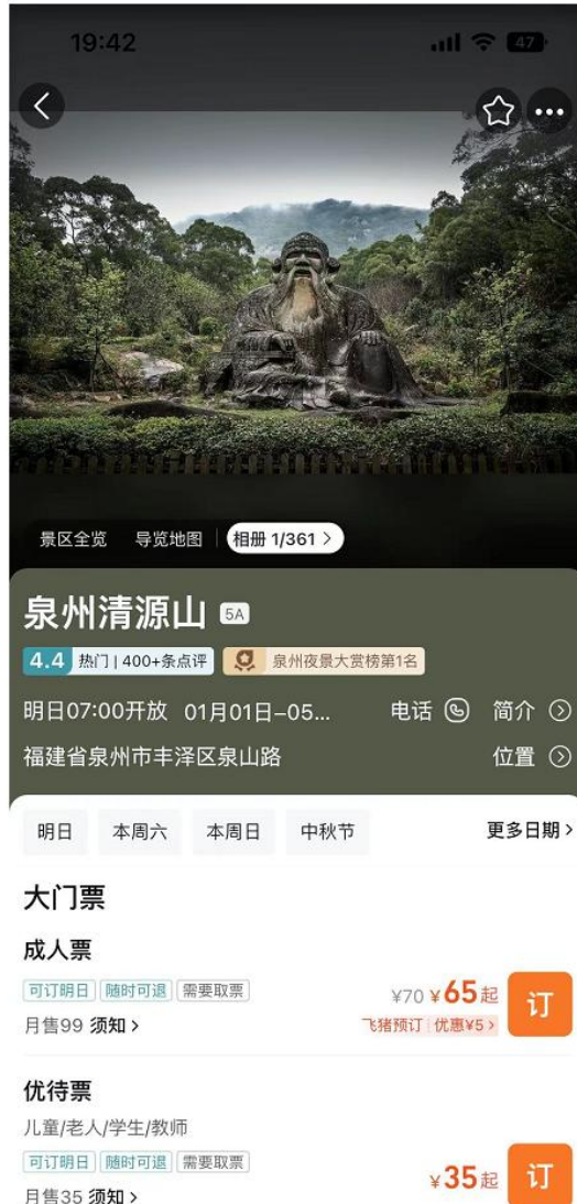
3-3: 飞猪旅行 APP;