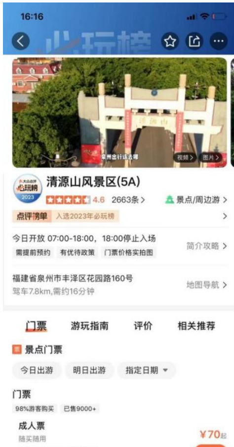
3-1: 大众点评 APP;